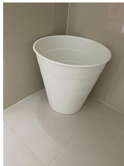
ภาพที่ 32 แสดงถังขยะภายในห้องพัก