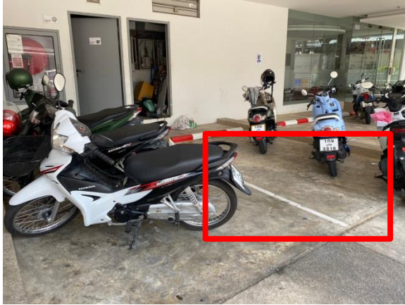
ภาพที่ 33 แสดงบ่อน้ำฝนใต้ลานจอดรถ