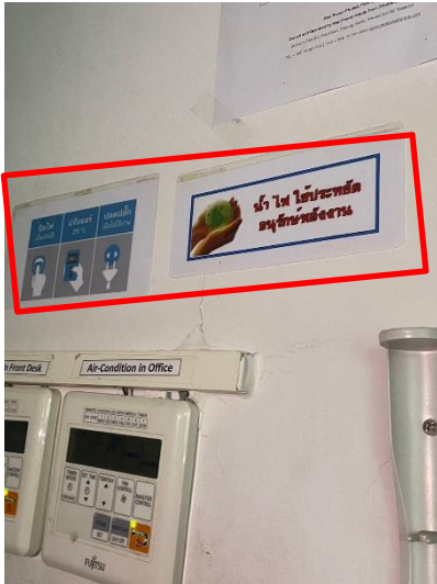
ภาพที่ 21 แสดงป้ายรณรงค์ประหยัดน้ำ/ประหยัดไฟ