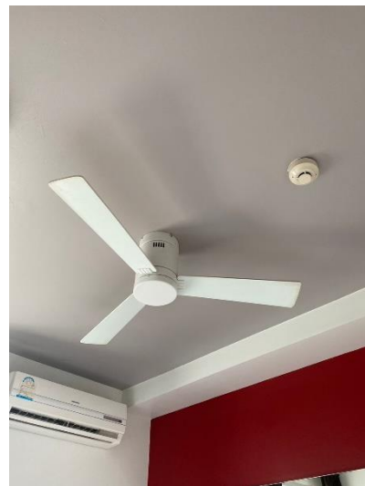
ภาพที่ 20 แสดงพัดลมภายในห้องพัก