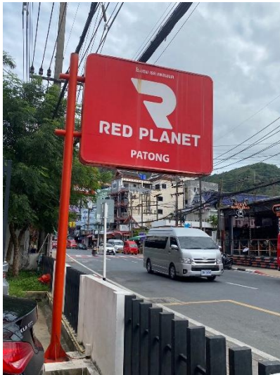
ภาพที่ 1 แสดงป้ายชื่อโครงการ