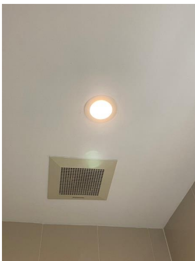
ภาพที่ 31 แสดงหลอดไฟ ชนิดประหยัดพลังงาน LED