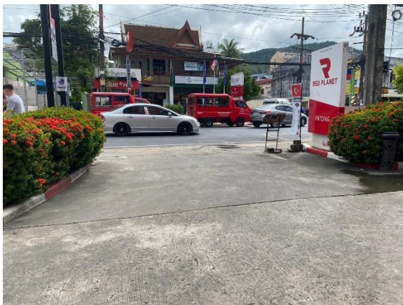
ภาพที่ 35 แสดงทางเข้า-ออกโครงการ