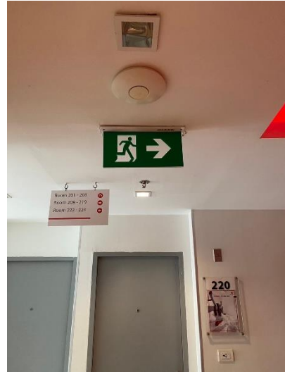
ภาพที่ 14 แสดงป้ายทางออก