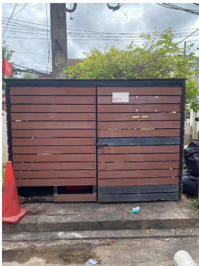
ภาพที่ 7 แสดงห้องพักขยะเปียกและขยะแห้ง