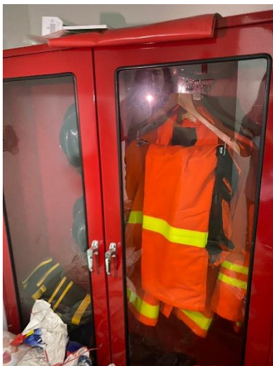
ภาพที่ 11 แสดงตู้เก็บชุดและอุปกรณ์ดับเพลิง