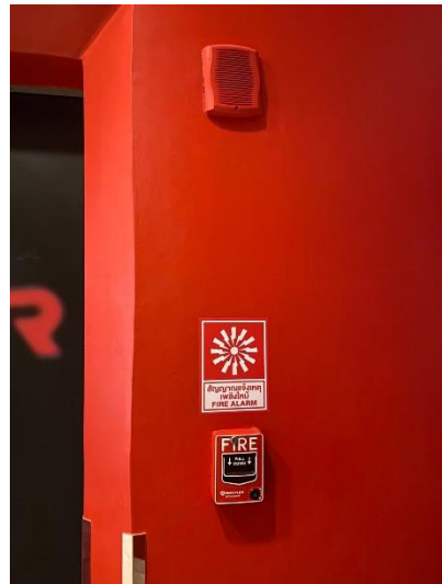
ภาพที่ 8 แสดงสัญญาณเตือนภัยแบบมือดึง