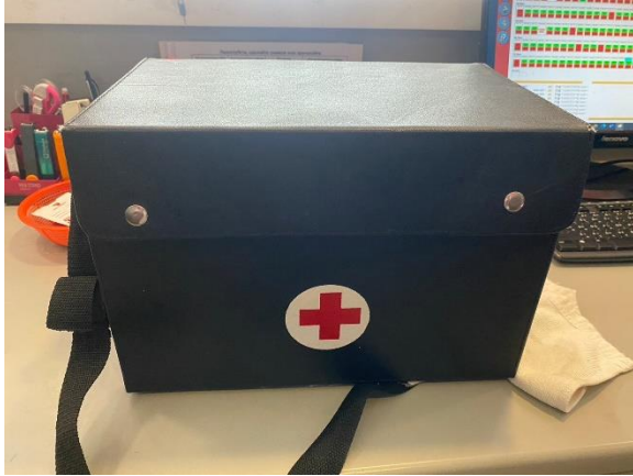
ภาพที่ 25 แสดงกล่องปฐมพยาบาล