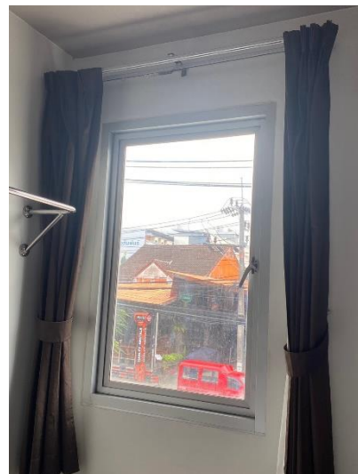
ภาพที่ 24 แสดงหน้าต่างระบายอากาศภายในห้องพัก