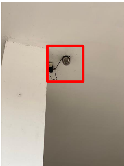
ภาพที่ 27 แสดงกล่องวงจรปิดบริเวณลานจอดรถ และ ทางเข้า-ออก