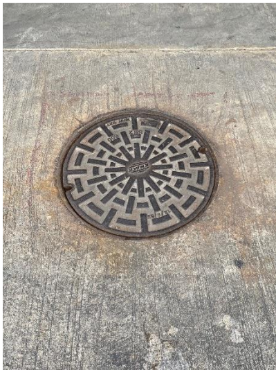
ภาพที่ 29 แสดง “ระบบบำบัดน้ำเสีย” ด้านล่างพื้นถนน