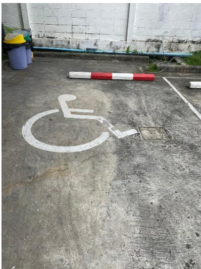
ภาพที่ 3 แสดงที่จอดรถสำหรับคนพิการ