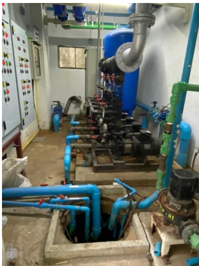
ภาพที่ 23 แสดงห้องปั้มน้ำและถังเก็บน้ำใต้ดิน