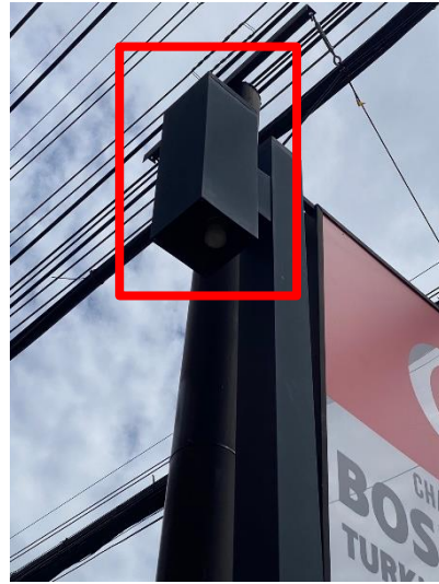
ภาพที่ 34 แสดงไฟส่องสว่างบริเวณทางเข้า-ออก