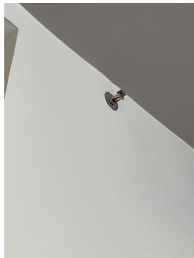
ภาพที่ 4 แสดงหัวกระจายน้ำดับเพลิงอัตโนมัติภายใน ห้องพักแขก