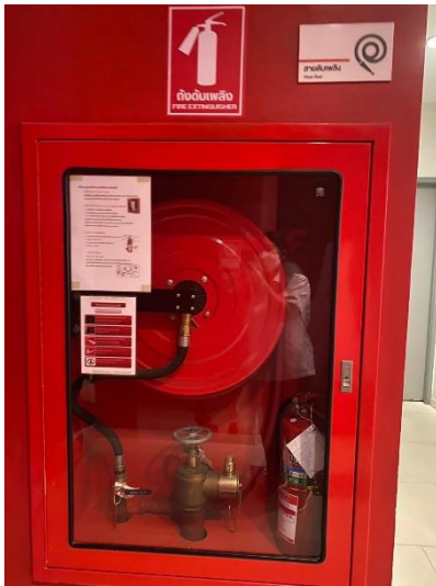
ภาพที่ 9 แสดงถังดับเพลิงและอุปกรณ์ดับเพลิง