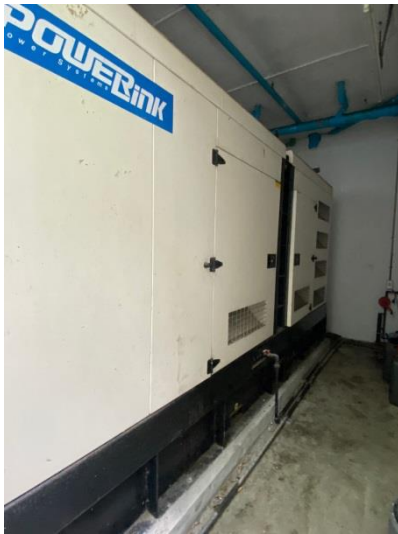
ภาพที่ 37 แสดงห้องเครื่องกำเนิดไฟฟ้า