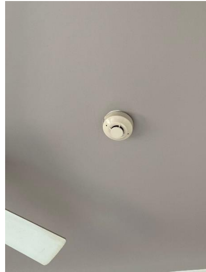
ภาพที่ 22 แสดง Smoke Detector ภายในห้องพัก