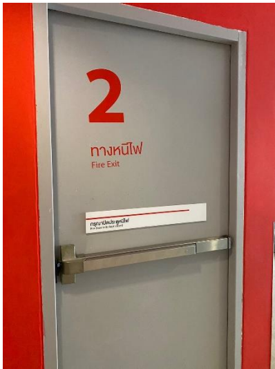
ภาพที่ 17 แสดงประตูทางหนีไฟ