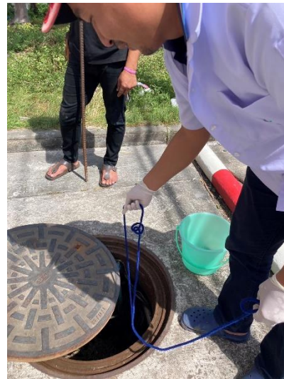
ภาพที่ 38 แสดงการเก็บตัวอย่างน้ำทิ้งหลังบำบัดไปตรวจวิเคราะห์