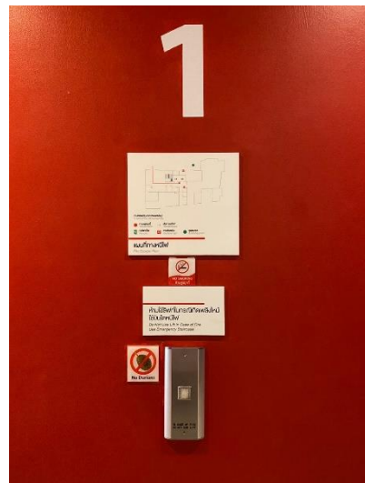
ภาพที่ 16 แสดงป้ายคำเตือนในการใช้ลิฟต์ บริเวณหน้าลิฟต์