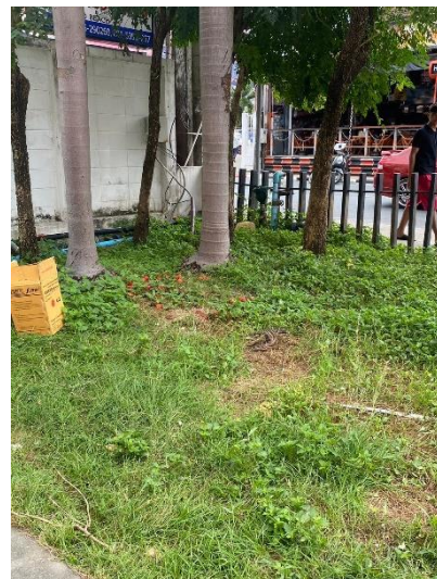
ภาพที่ 12 แสดงพื้นที่สีเขียว