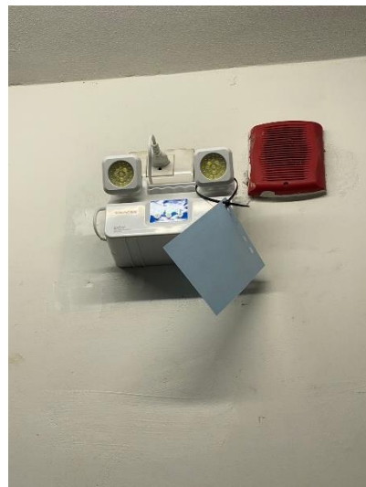
ภาพที่ 28 แสดงไฟฉุกเฉินภายในอาคาร