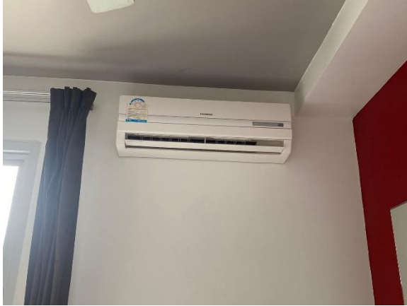
ภาพที่ 5 แสดงเครื่องปรับอากาศประหยัดไฟเบอร์ 5