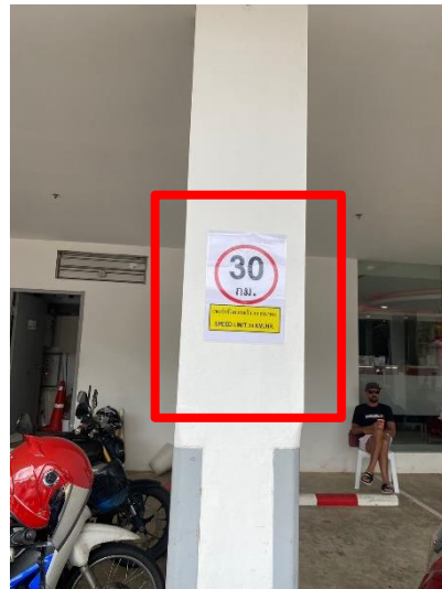
ภาพที่ 26 แสดงป้ายจำกัดความเร็ว 30 กิโลเมตรต่อชั่วโมง