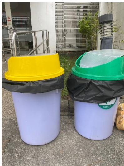
ภาพที่ 15 แสดงถังขยะแยกประเภท บริเวณด้านหน้าอาคาร