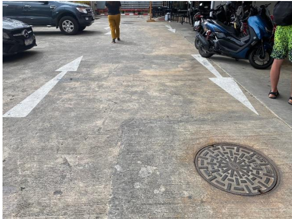
ภาพที่ 13 แสดงสัญลักษณ์จราจรภายในโครงการ