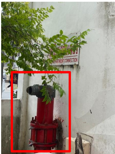
ภาพที่ 19 แสดงหัวรับน้ำดับเพลิงจากภายนอก