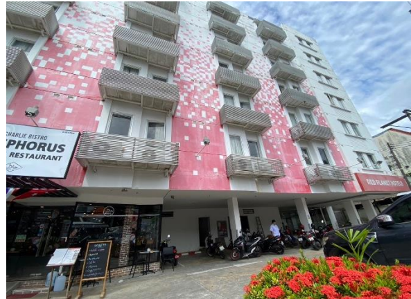
ภาพที่ 2 แสดงภูมิสถาปัตยกรรมของโครงการ