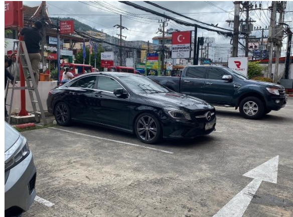
ภาพที่ 10 แสดงลานจอดรถยนต์ภายในโครงการ