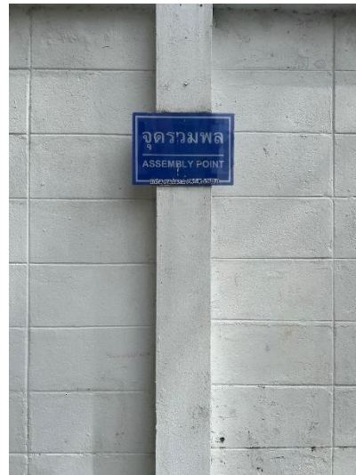
ภาพที่ 18 แสดงจุดรวมพล