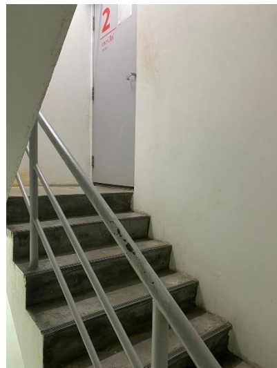
ภาพที่ 36 แสดงบันไดหนีไฟ